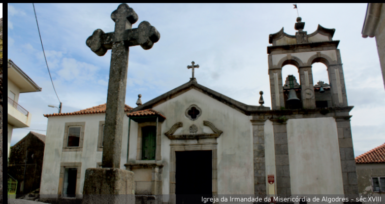
Igreja da Irmandade da Misericórdia de Algodres - séc. XVII