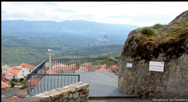
Miradouro do Comborço